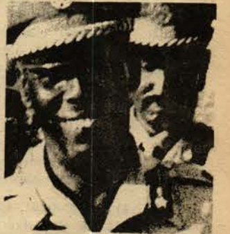
Somali Devlet Başkanı Siad Barre...

Bütün bu gelişmeler bir kez daha şunu gösterdi ki, başka ülkelerin bağımsızlığına, egemenliğine ve toprak bütünlüğüne karşı saldırıya girişenlerin yanında sadece ırkçılar, gericiler ve süper devletler vardır.