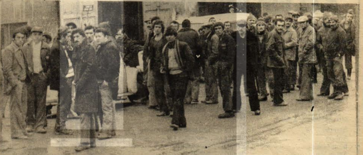
DEMİR DÖKÜM İŞÇİLERİ İŞBAŞI YAPTIKLARI GÜN

Maden-İş yöneticileri, önder işçileri fabrikalardan attırarak muhafazetini yok edemezler. Taşı ne kadar yükseğe kaldırırlarsa o kadar şiddetle ayaklarına düşecektir.