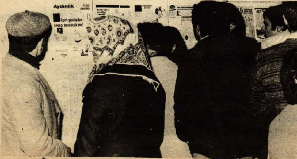
AYDINLIK'a gelen ziyaretçiler, deneme yayınlarının fotokopilerini inceliyorlar.

"Demir Döküm'den atılan işçi arkadaşlar DİSK Genel Merkezine gittiler. Onun haberini koyduk, son sözleşmenin yaratıldığı tepkileri topladık. Çitos-İş Genel Başkanının demecini verdik, yine bu sözleşme ile ilgili. MESS sözleşmelerinin imzalanmasının ardından işçilerin duygu ve düşüncelerini yansıtmaya çalışıyoruz. Sayfamızı şu anda verdik, mizanpajı yapıldı. Sayfanın düzenlenmesi sırasında kendi düşüncelerimizi de belirterek arkadaşlara yardımcı olmaya çalışıyoruz."