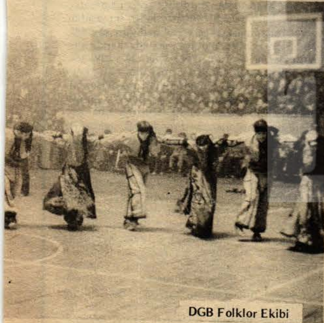
DGB Folklor Ekibi

Analar, kucağı çocuklu gelinler, işçiler, memurlar büyük bir şevkle bağışta bulunuyordu. Gece biterken salon binlerce İstanbullunun "Ne Amerika Ne Rusya Bağımsız Türkiye", "Katiller Bulunsun, Hesap Sorulsun" sesleriyle inliyordu.