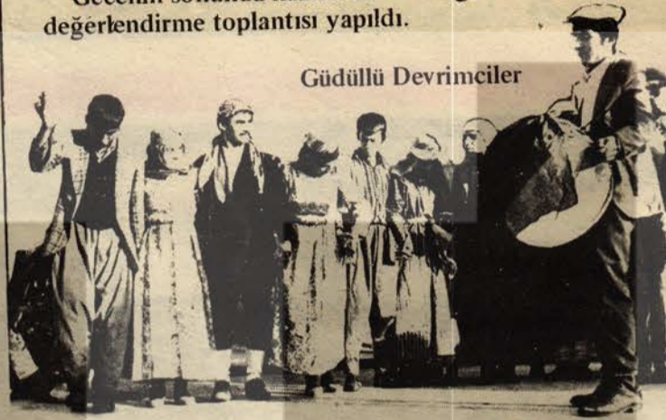
Güdü Halkevi Devrimcileri

Gecenin sonunda halkın da katıldığı bir değerlendirme toplantısı yapıldı.