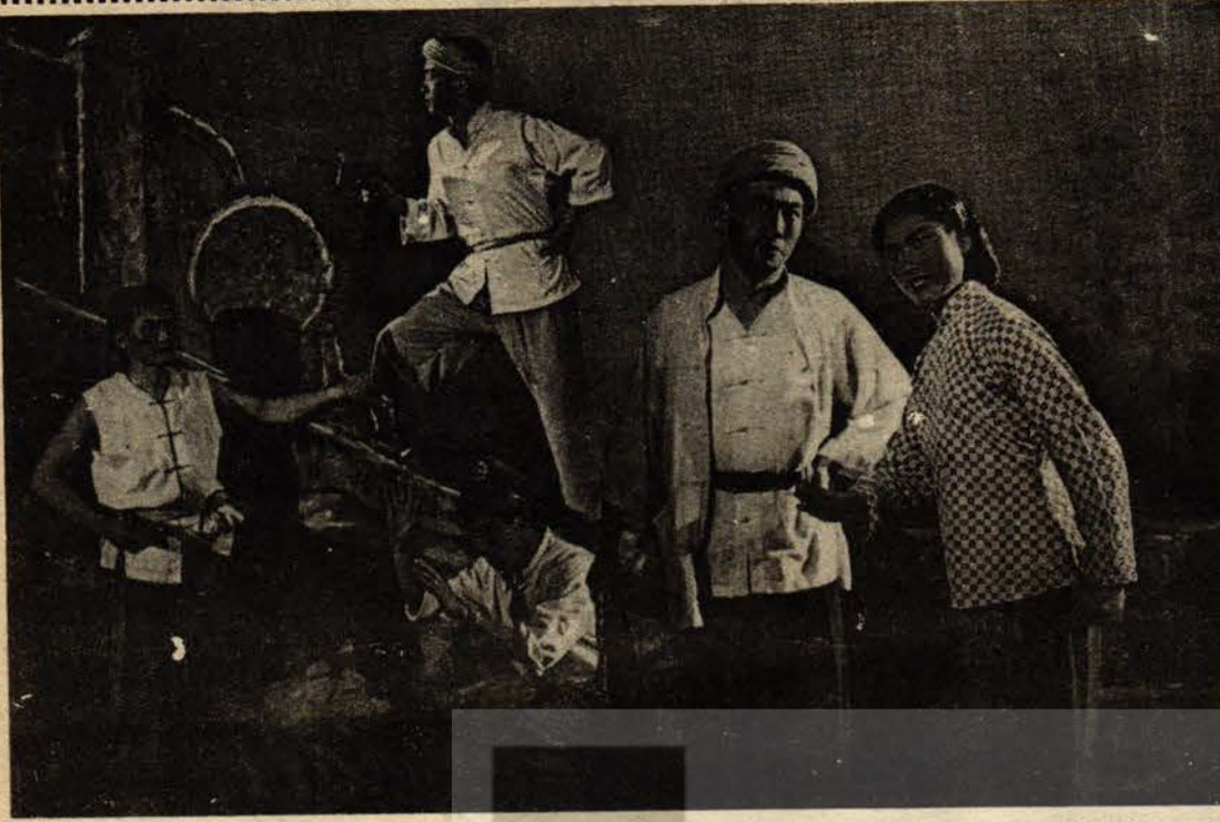
"Kızıl Kayalar" romanı, romanın başkahramanlarından "Çiang Çie" (Çiang' abla) adıyla opera haline getirildi. Yukarıda, bu operadan canlı bir sahne görülüyor.