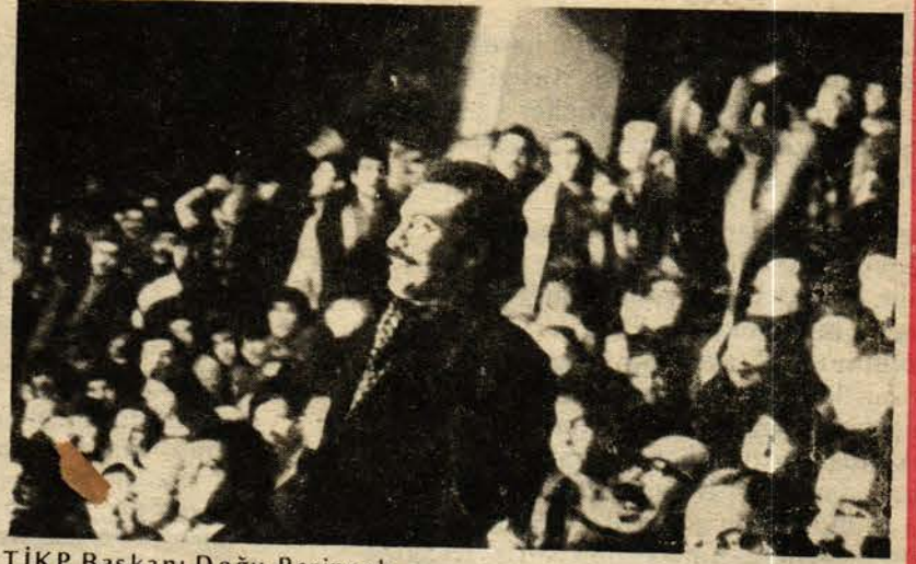
TİKP Başkanı Doğu Perinçek

Şubat Cuma akşamı... Spor Sergi Sarayı m tıklım... AYDINLIK'ı destekleme gecesine an İstanbullular koridorlara taşıyor.